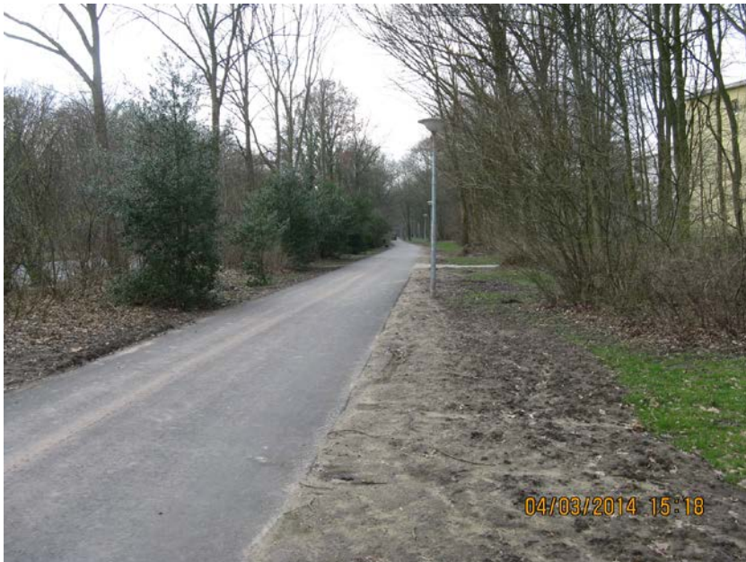
Beispiel: Grünzug Richard-Boljahn-Allee (Vahr)