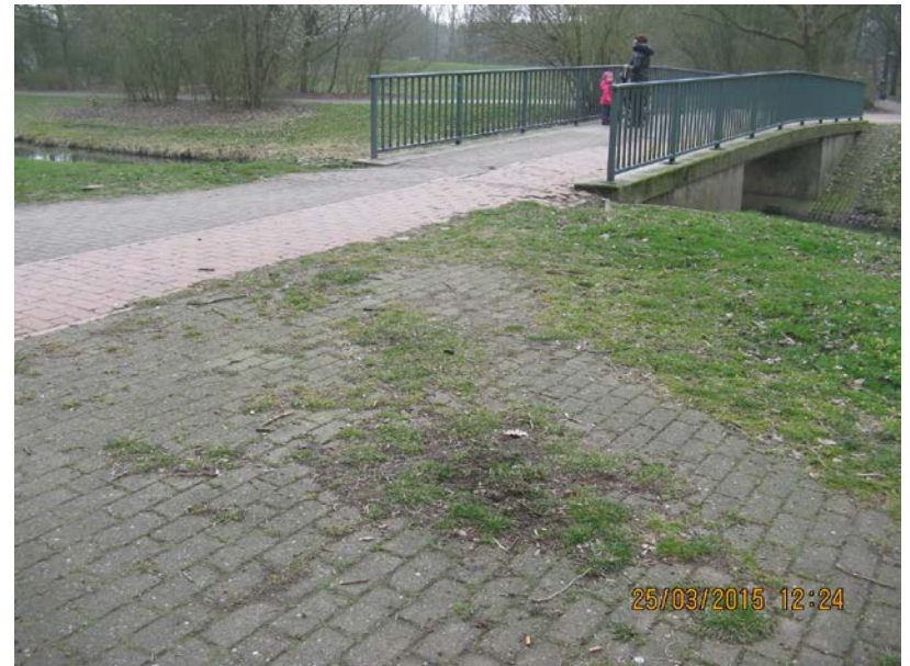
Brücke in Höhe Wischmannstraße