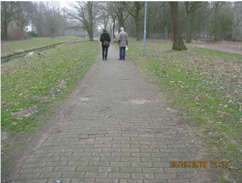
Dreifach-Wegeführung östlich A.-Faust-Str.