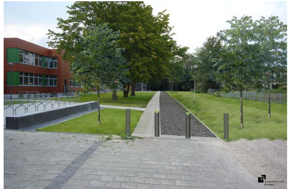
Beispiel: Mittlere Quartiersachse (Neustadt)