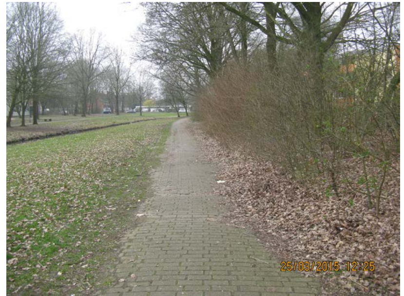
nördlicher Weg östlich Alfred-Faust-Str.