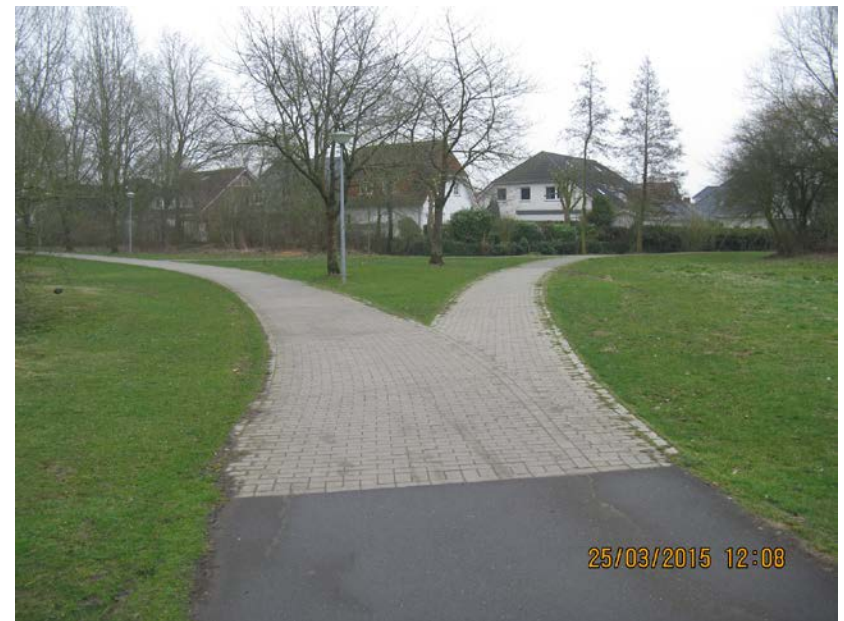
bereits sanierte Wege Höhe Dibberser Straße