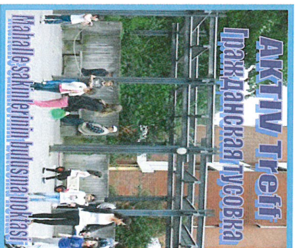
Ob drinnen oder draußen, ob jung oder alt für Menschen aus jedem Kulturkreis, der AKTIV Treff ist ein Ort, wo alle zusammen finden können.